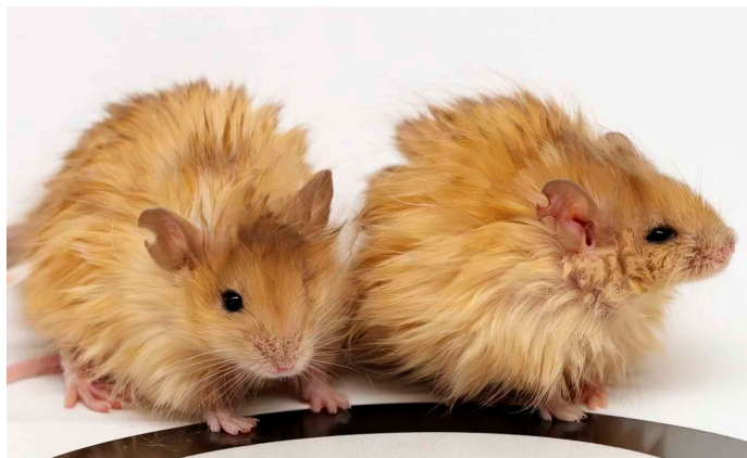
De wolharige muizen.

De BBC vatte bijvoorbeeld samen dat het genoom van olifanten veel minder bekend is en dat eventuele neveneffecten lastig te voorspellen zijn, dat de wolharige muizen vooral op basis van bekende genen gemaakt zijn, en dat een gemanipuleerde olifant verstoten zou kunnen worden door de kudde. Veel wetenschappers noemen dit dus ook een publieksstunt en geloven niet dat er daadwerkelijke wolharige olifanten uit het project zullen volgen.