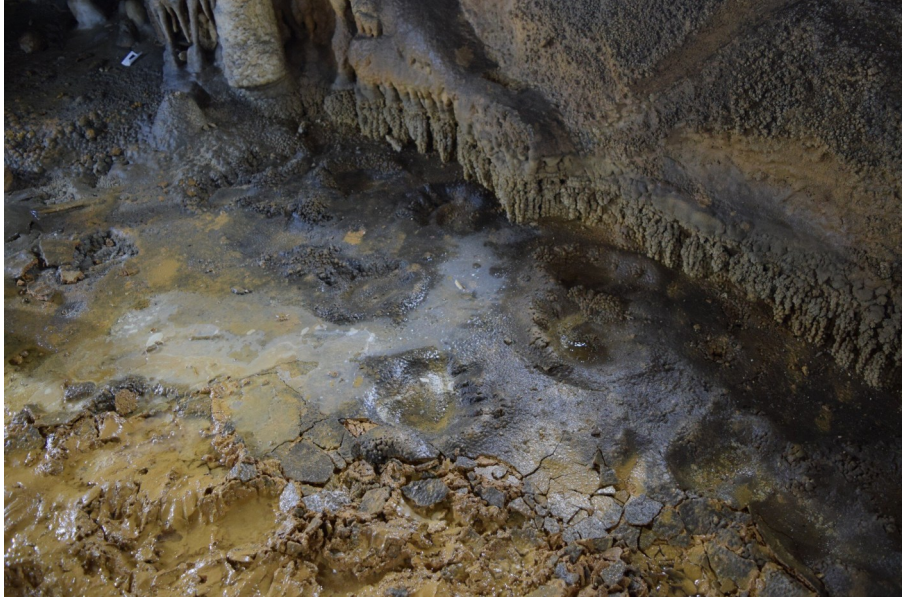
De voetsporen van de beren.