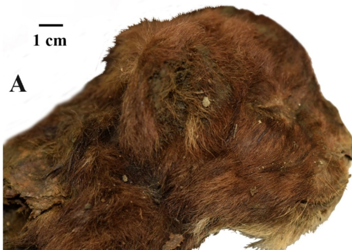
De kop van het welpje van Homotherium latidens .

“For the first time in the history of paleontology, the external appearance of an animal that has no analogues in the modern fauna has been studied.” (citaat van Lopatin et al.)