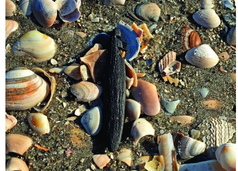
Poster voor het project "Resurfacing Doggerland" door Merel Spithoven. Meer hierover leren? Kom dan naar de komende bijeenkomst die in deze editie beschreven wordt!